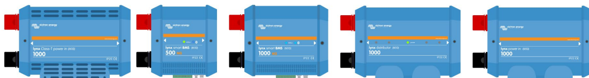
Productos del sistema de distribución Lynx con embarrados M10