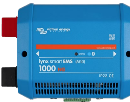
Lynx Smart BMS NG 1000 A